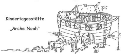
Kindertagesstätte „Arche Noah“