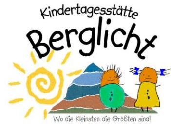
Wo die Kleinsten die Größten sind!