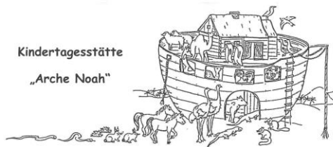
Kindertagesstätte „Arche Noah“